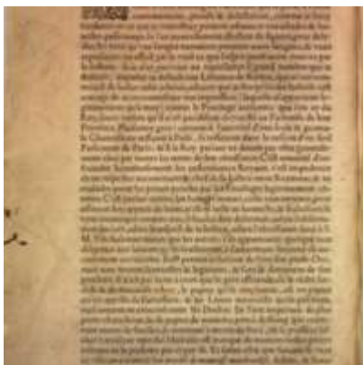
Mythologie, Lyon, 1612 - L'Imprimeur au bening Lecteur

Les 3 premiers documents de la collection :