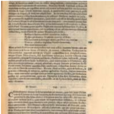
Mythologia, Venise, 1567 - V, 03 : De Nemeis Conti, Natale