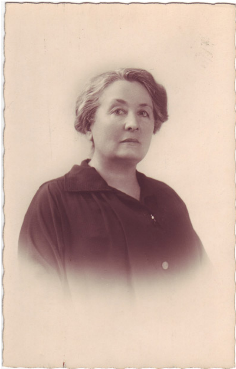
Carte de visite de Marguerite Audoux à Alain-Fournier Audoux, Marguerite